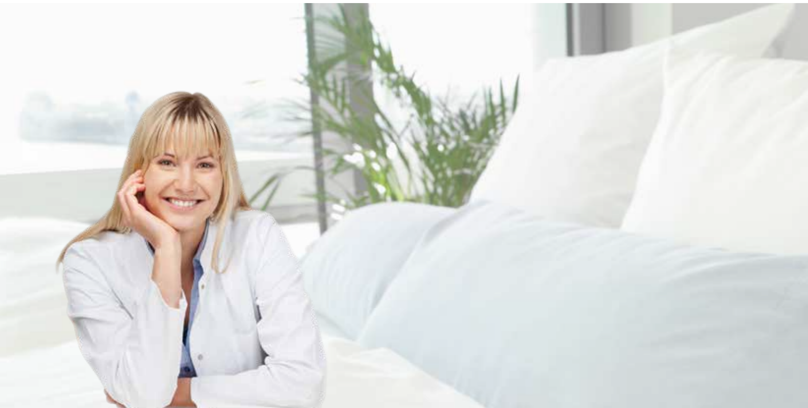
JOYCEeasy next FF