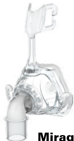
Mirage™ FX MASQUE NASAL