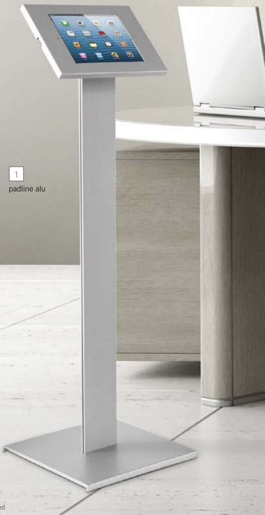
1 padline alu