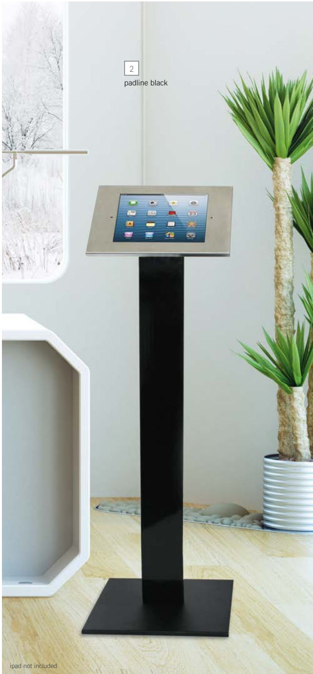
2 padline black