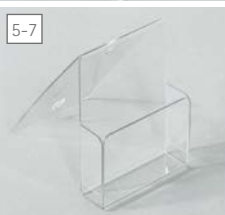
tasca portadepliant realizzata in PETG, formato DIN A4, DIN A5 o DIN A6.

poster pocket made of PETG, DIN A4, DIN A5 or DIN A6.