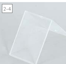
tasca ad inserimento realizzata in PETG, formato DIN A4, DIN A5 o DIN A6.

EN the idea is simple - and internationally protected: just put the trays on the bar. arrange level and direction of every single tray according to your needs thanks to the resilience of the elastic material. trays are available in common sizes. choose poster pockets or brochure trays in different sizes and combine freely. liftboy – the smart information display for stylish price tagging and elegant product information.