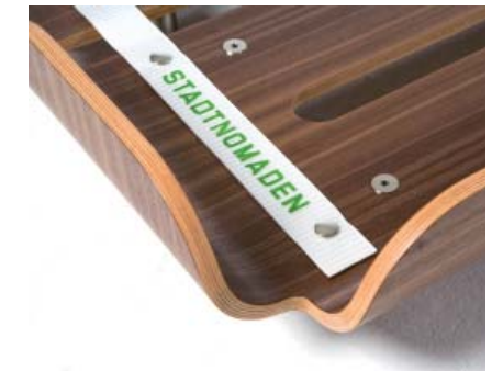
Verbindung per Knopfdruck | Connecting belt

Die leicht federnde Rückenlehne sorgt für große Gemütlichkeit bei einer spannenden Bettlektüre. Sie lässt sich nachträglich am Bett Tiefschlaf (nicht TS II) anbringen. Die schlanken Lehnbügel verbinden Teile des Bettgestells mit dem in passender Oberfläche erhältlichen Lehnenteil.