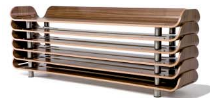
Stapelfunktion | Pack size

The pieces can be stacked, thus reducing the volume to a minimum when it has to be transported, so that even the most discriminating traveller can combine quality and mobility. The construction of the bed allows the use of any mattress.