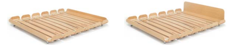
Eichefurnier, lackiert | Wooden veneer (Oak), varnished

Die federnde Eigenschaft eines Lattenrostes, welche die vier Mittelschalen bereits in der Herstellung erhalten, kann über eine stufenlose Verstellung der Aluminium-FüÙe im Handumdrehen in ihrem Härtegrad feinjustiert werden. Über Druckknöpfe werden die sechs Elemente mühelos mit einem Gurt zusammengesetzt und bilden im Verbund einen Rahmen, in den das jeweils bevorzugte Polsterteil eingelegt werden kann. Der Gurt legt den Abstand der Formteile zueinander fest. Die so entstehenden Zwischenräume, in Kombination mit den Ausfräsungen in der Auflagefläche, ermöglichen die Verwendung jeder Matratzenart, und sorgen für die notwendige Belüftung.