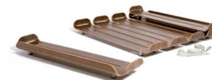
Aufbau | Set up

Tiefschlaf consists of six shaped wood modules which at the snap of a fastener turn into a comfortable bed. The unobtrusive shape of the modules combines bed sides and the slatted frame in a smart way.