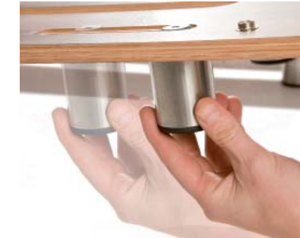
Fußverstellung | Adjustable legs