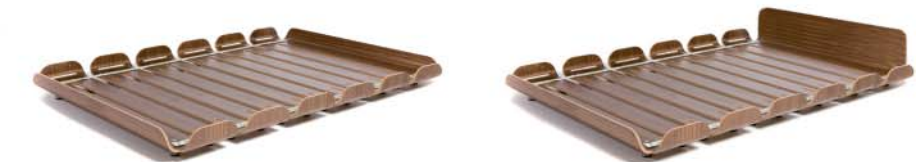
Nussbaumfurnier lackiert | Wooden veneer (Walnut), varnished