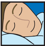
für Ruhe und besseren Schlaf

Sodormwell sollte wie alle Schlafmittel erst eingenommen werden, wenn die üblichen und durchaus wirksamen Hausmittel versagen. Also zum Beispiel pflanzliche Beruhigungsmittel wie Baldrian, der kurze Abendspaziergang, keine aufregenden Filme kurz vor dem Schlafengehen, keine scharf gewürzten oder belastenden Speisen nach 18.00 Uhr oder auch das warme Glas Milch vor dem Zubettgehen.