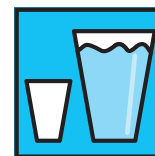
mit viel Flüssigkeit einnehmen

Paracetamol von Sophien-Arzneimittel ist ein seit langem bewährtes Medikament in Apotheken-Qualität. Jahrelange Erfahrung in meiner Apotheker-Praxis haben die Wirksamkeit von Paracetamol immer wieder bestätigt. Paracetamol kann über mehrere Tage hinweg eingenommen werden, dennoch sollte die Einnahme nicht zu lange erfolgen. Im Zweifel fragen Sie besser Ihren Arzt oder Apotheker.