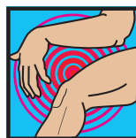
bei Glieder- schmerzen