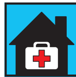
für Ihre Hausapotheke