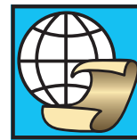
einer der ältesten Wirkstoffe der Welt

ASS 500 von Sophien-Arzneimittel ist ein wirksames Medikament in Apotheken-Qualität. Jahrelange Erfahrung in meiner Apotheker-Praxis haben die sichere und vielseitige Wirkung von ASS immer wieder bestätigt. ASS 500 sollte nicht regelmäßig auf nüchternen Magen eingenommen werden, das kann bei empfindlichen Personen zu einer unangenehmen Magenreizung führen.