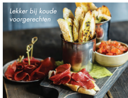
Lekker bij koude voorgerechten