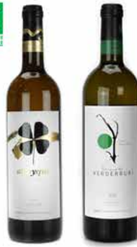
16 17 "100% Verdejo, 100% Biologisch"