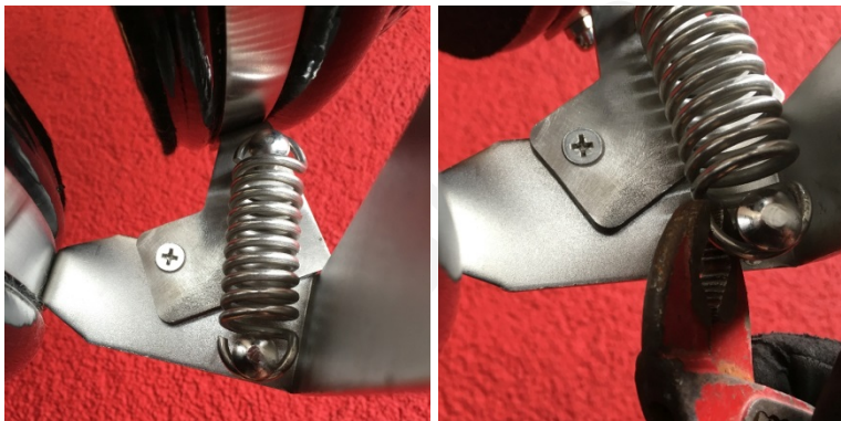
spring right side of the hinge unhook spring with adjustable joint pliers

Maak nu de veren los van de scharnier haken en sluit het deksel zorgvuldig. Laat het deksel niet vallen.