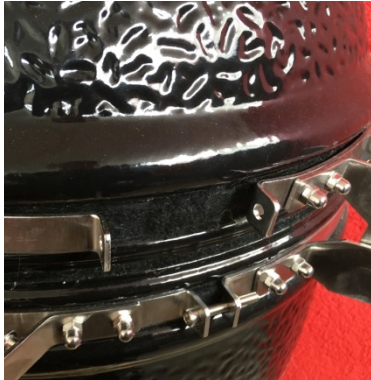
top metal band / lock ring with removed tensioning screw

Draai de spanningschroeven van de metalen band los. Doe dit bij de band waar de scharnier haken niet helemaal goed uitgelijnd zijn.