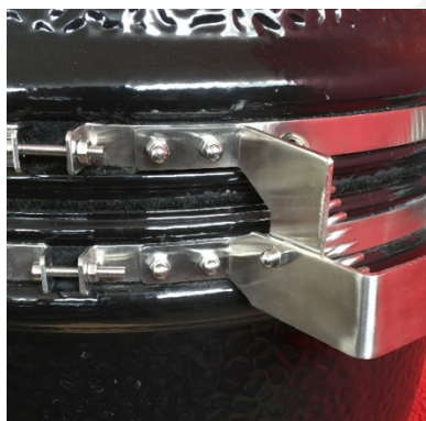
4 domed nuts left side of the hinge / domed nut left axis

Stel nu de spanning van de metalenbanden of door de spanningsschroeven aan te draaien. Dat zijn de schroeven die de beide einden van de metalen ring bij elkaar houden. Elke band heeft 1 schroef . Draai ze aan met de inbusleutel en de steeksleutel. De inbusleutel zorgt ervoor dat de schroef niet meedraait wanneer je de moer aan gaat draaien.