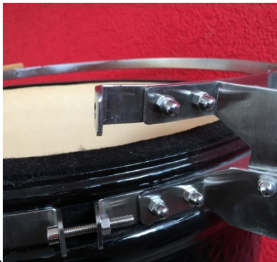
Latch after adjustment

Wanneer u de scharnierhaken heeft uitgelijnd dan kunt u de schroeven weer stevig aandraaien. Let op dat de haken niet verschuiven ten op zichte van de span band.