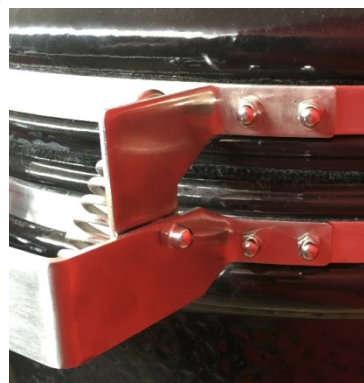
4 domed nuts right side of the hinge / domed nut right axis