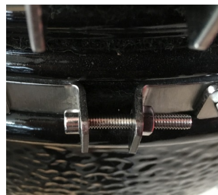
Tensioning screw / metal band/lockring with latches bending to each other