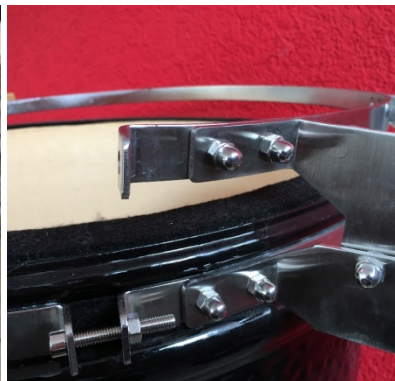
unscrew the 4 domed nuts off the top metal band (right and left latch)