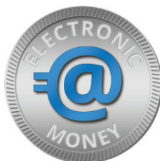
myPOS e-money account