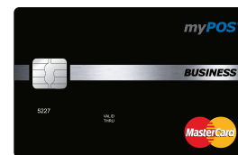
myPOS Business Card