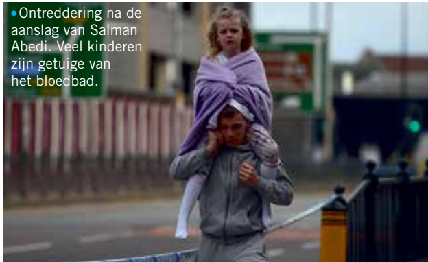
• Ontreddering na de aanslag van Salman Abedi. Veel kinderen zijn getuige van het bloedbad.

→ MANCHESTER - HET WAS EEN MOOI CONCERT GEWEEST. VAN SLAAP KUNNEN DE ALLERJONGSTE FANS VAN ARIANE GRANDE HUN OGEN AL NIET MEER OPEN HOUDEN. Aan de hand van, of in de armen van hun ouders lopen ze naar het treinstation dat aan de Manchester Arena vast zit. Daar staat Salman Ramadan Abedi, zoon van een vader die in de Libische burgeroorlog vocht, telg van een gezin dat bekendstaat als extremistisch. De inlichtingendiensten hebben niet op tijd ingegrepen: Abedi ontsteekt de spijkerbom in zijn rugzak. Hij neemt 22 mensen mee de dood in. Nog eens 250 raken er gewond. ■