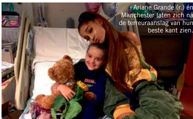
• Ariane Grande (r.) én Manchester laten zich na de terreuraanslag van hun beste kant zien.