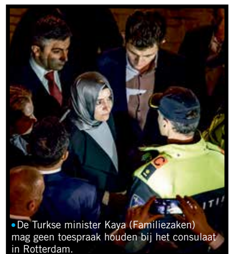
• De Turkse minister Kaya (Familiezaken) mag geen toespraak houden bij het consulaat in Rotterdam.