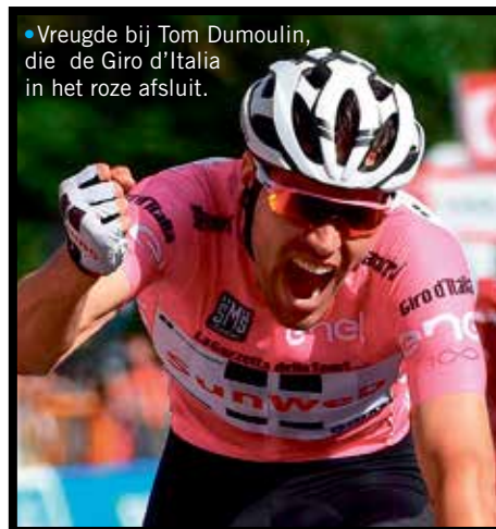
• Vreugde bij Tom Dumoulin, die de Giro d'Italia in het roze afsluit.

→ MILAAN - WAT EEN HELD! TOM DUMOULIN DOET WAAR GEEN NEDERLANDER OOI IN SLAAGDE: HIJ WINT DE GIRO D'ITALIA. NEDERLAND KLEURT ROZE. Maar misschien nog wel meer dan aan zijn roze trui, zal Dumoulin voor altijd herinnerd worden aan de meest opmerkelijke sanitaire stop uit de wielergeschiedenis. Op ruim dertig kilometer voor de finish van de zestiende etappe in Bormio houden de darmen van de Limburger het niet meer. Als door een wesp gestoken duikt Dumoulin van zijn fiets, de berm in, om de natuur haar beloop te laten hebben. Nederland kijkt met samengeknepen billen toe hoe Nairo Quintana de klassementsleider bijna zijn complete voorsprong afsnoept. Van de bijna drie minuten die Dumoulin in een tijdrit én in de bergen heeft opgebouwd, blijven 31 tellen over. Een paar dagen later pakt Quintana zelfs het roze, maar hij weet het niet tot Milaan vast te houden. De laatste rit van de honderdste Giro is immers weer een tijdrit – de specialiteit van Dumoulin, een gruwel voor de Colombiaanse berggeit Quintana. Dumoulin wint de slottijdrit niet – dat doet de Nederlander Jos van Emden –, maar gaat wel over Quintana heen. Hij wint de Giro, ondanks die sanitaire stop, glansrijk. ■