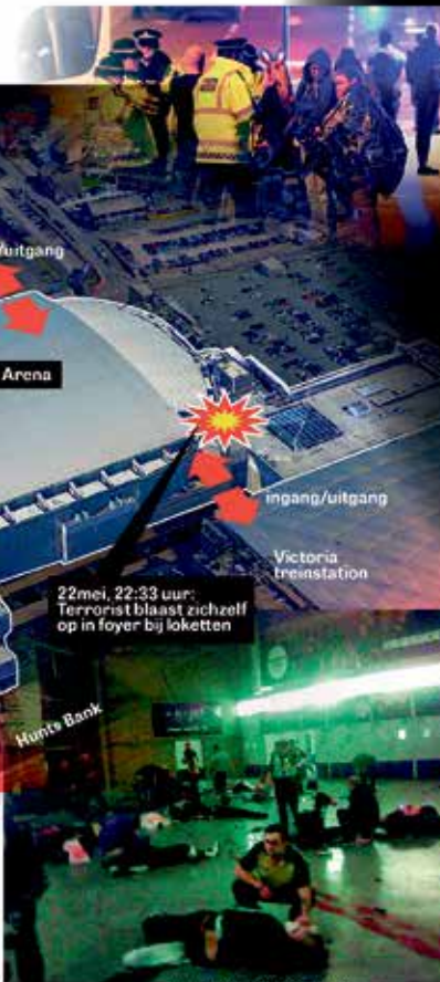
ILLUSTRATIE REDACTIE VERBUURING