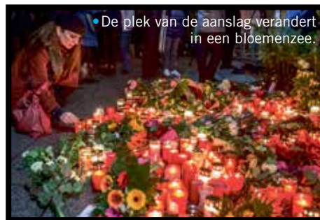
• De plek van de aanslag verandert in een bloemenzee.