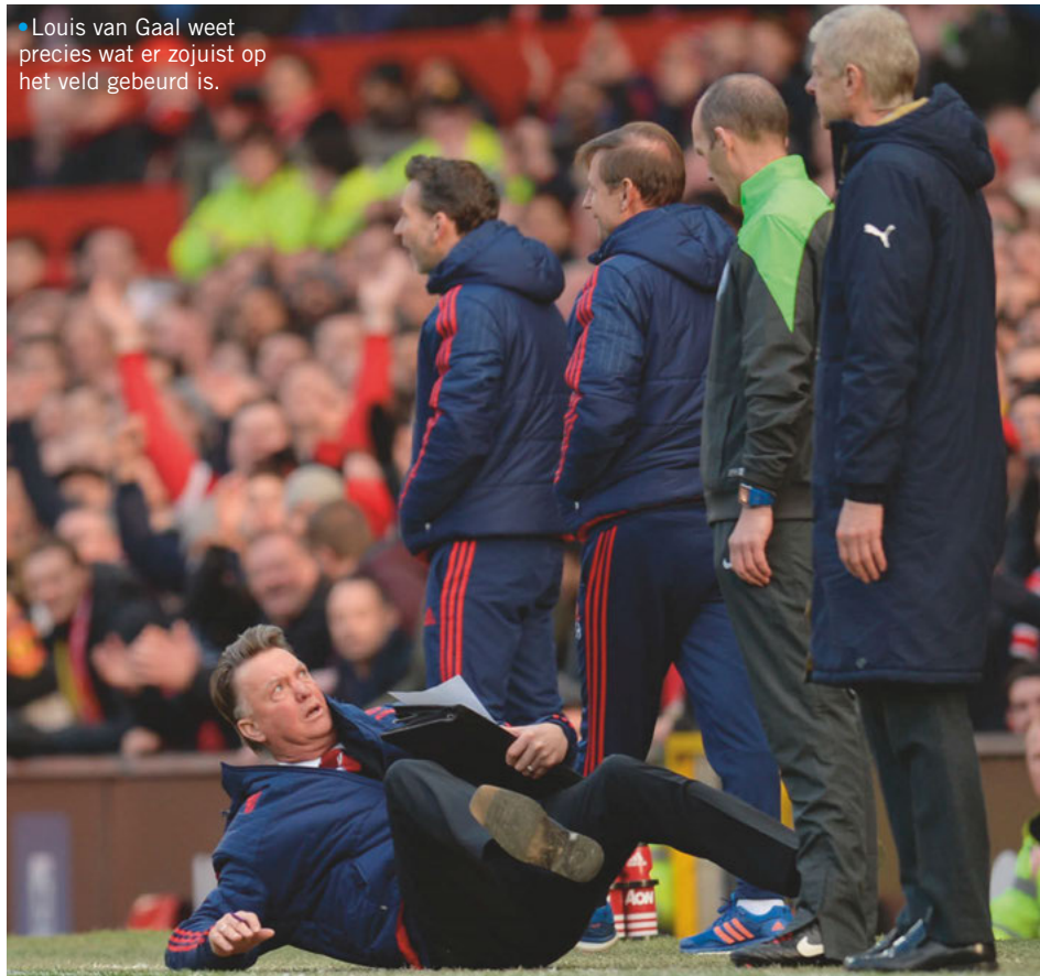
• Louis van Gaal weet precies wat er zojuist op het veld gebeurd is.

→ MANCHESTER - WAT JE OOK VAN LOUIS VAN GAAL VINDT: SAAI IS HET MET DE HOLLANDSE OEFENMEESTER NOOIT.