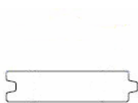
Doorsnede KLP ® Veer & Groef plank