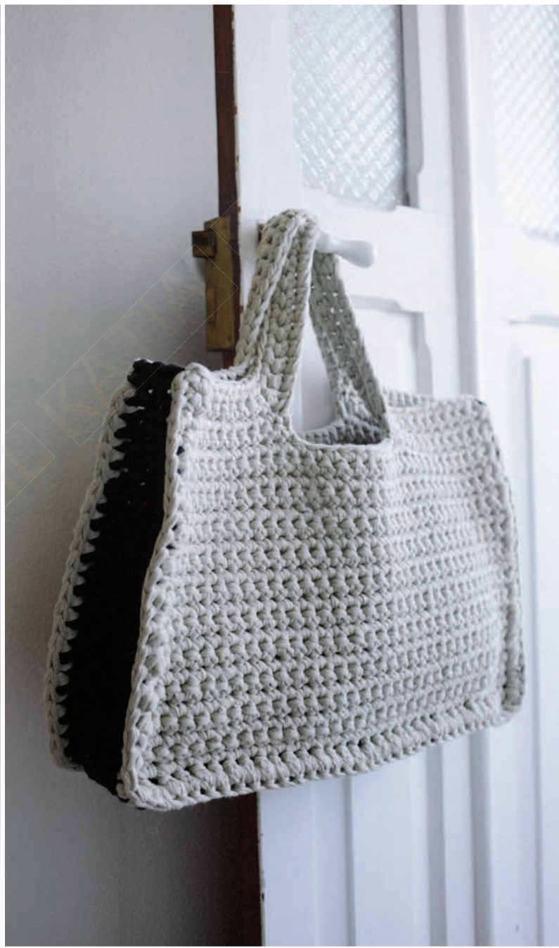
63. BIG RIBBON