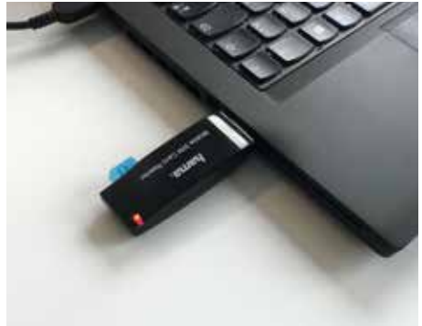
Alternativ: USB SIM-Kartenleser

Tritt bei der Inbetriebnahme ein Problem auf (z.B. PIN nicht deaktiviert oder kein Empfang), so informiert Sie der TRAPMASTER durch akustische und optische Fehlercodes (Piepsen und Blinken). Eine Liste der Fehlercodes finden Sie am Ende dieses Dokuments.