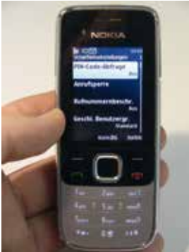
PIN per altem Handy deaktivieren

Eine Alternative sind USB-Adapter (Suchbegriff „Sim Card Reader“) für den PC, mit denen Sie die SIM-Karte über Ihren Rechner auslesen und bearbeiten können.