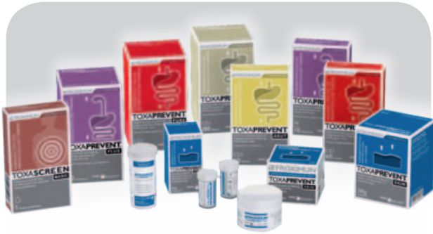
Die FROXIMUN® TOXAPREVENT® Produktserie – für die innere und äußere Anwendung