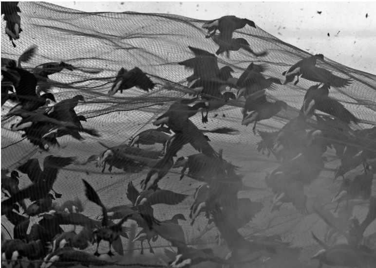
Nadat het kanonnet over de ganzen heen is geschoten, valt het naar beneden met de ganzen eronder.

Het net waarmee de rotganzen zijn gevangen is een zogenaamd kanonnet. De ganzenvangers doen dit niet voor de kost, het zijn