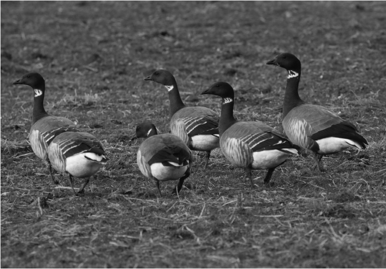
Familie rotganzen met vier jongen. De ouders zijn aan hun effen grijze rug te onderscheiden van de jongen. Rechts de vader, een derde van links de moeder. De witte eindzoompjes van de vleugeldekken zorgen voor de witte dwarsstrepen op de ruggen van de jongen.

nieuw vlak over het keetje heen, waarin de vangers zich schielijk hebben teruggetrokken. Rotganzen zijn bang voor mensen, en met recht. Van de keet zelf trekken de ganzen zich echter niets aan. Als er alweer een paar honderd langs de keet naar de vlakte benoorden de duintjes zijn gevlogen, draait er een groepje van elf ineens bij en valt klapwiekend in. Op de kwelder vlak voor de keet. Dat ziet er goed uit. Het zijn twee gezinnen: een paartje met vier jongen en een paartje met drie jongen. Die jongen zijn nu bijna een jaar oud, maar zijn de hele winter bij hun ouders gebleven. Aan hun vleugeldekken is nog te zien dat ze vorige zomer geboren zijn. Die hebben nog een smal wit randje. De ouders hebben een mooie effen grijze rug.