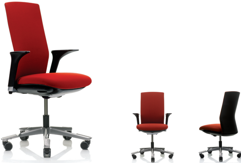
HÅG Futu 1020/ Standard armleggers of 3D armleggers (optie)