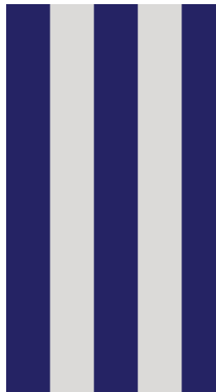
stripes navy / light sand