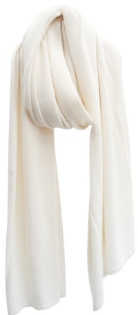
aantal: creamy white