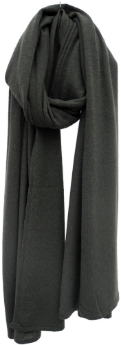
army green melee