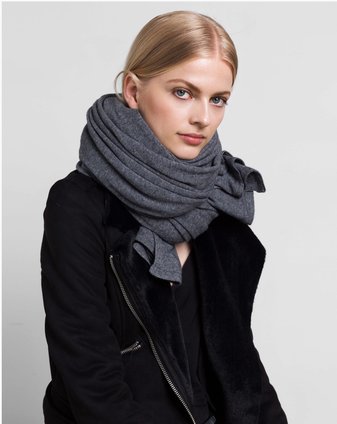
Cosy Mid Grey Melee