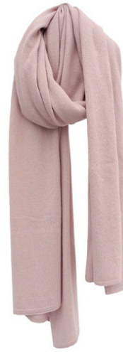
powder blush melee