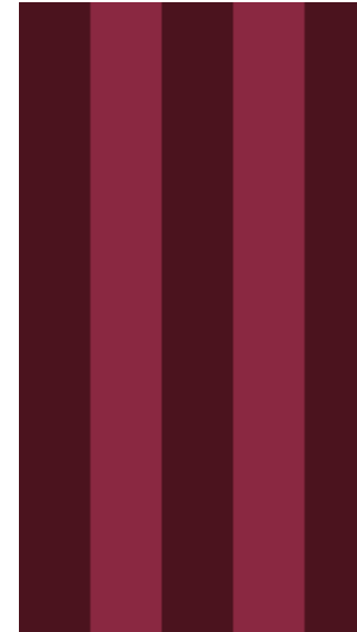
stripes dark burgundy / marsala