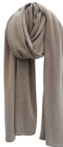
soft taupe meele