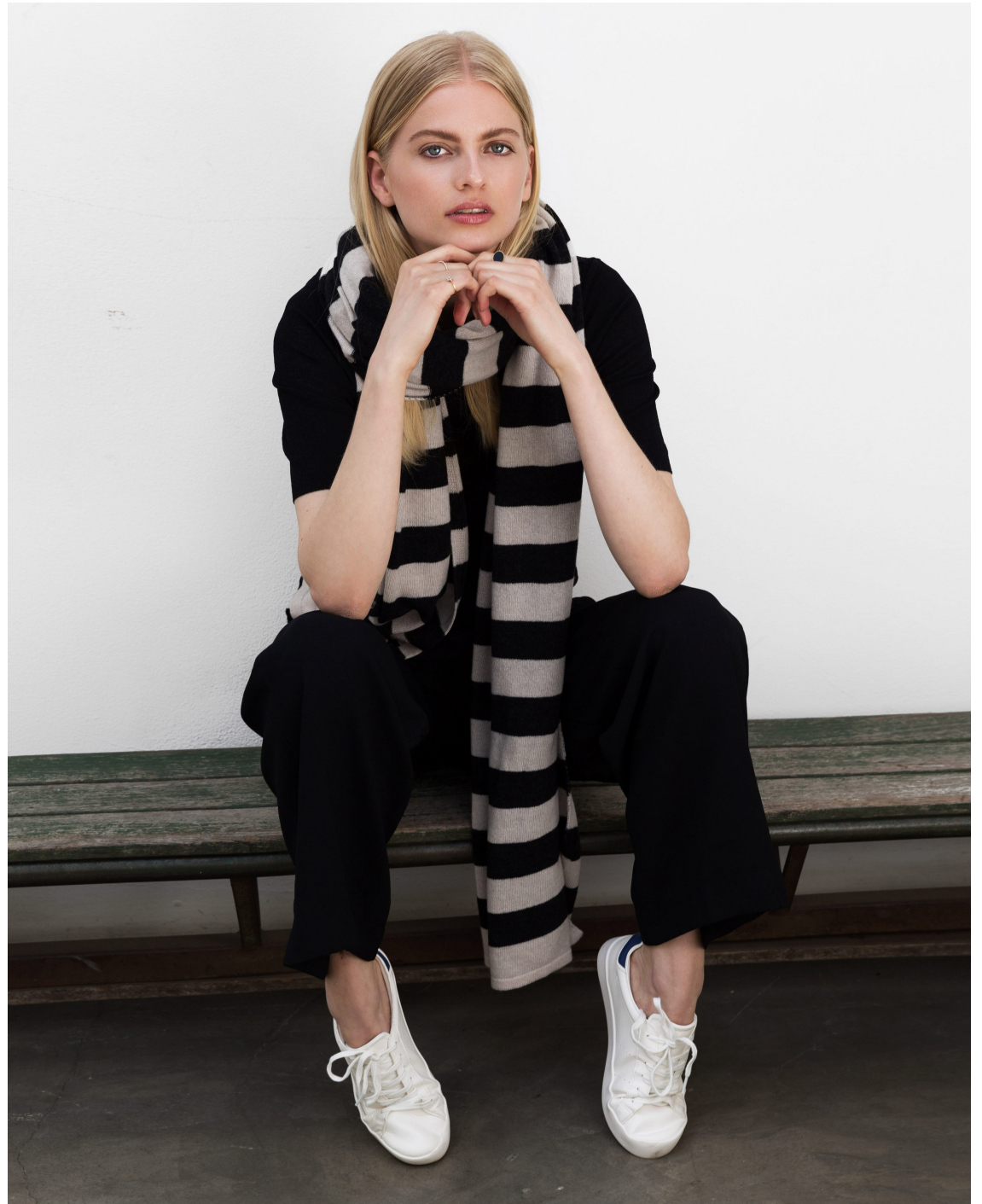
Cosy Chic Stripes Black & Sand