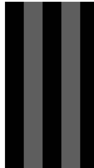
stripes black melee/ mid grey