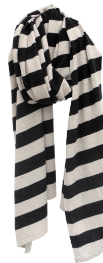
stripes black meele/ light sand