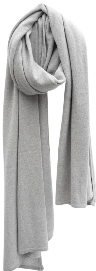
pearl grey meele