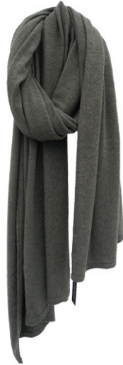
army olive melee