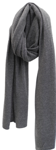
mid grey meele