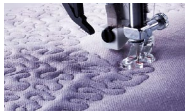
Naaien uit de vrije hand – laat uw verbeelding de vrije loop.

Professionele nuttige steken, perfecte knoopsgaten en een enorme hoeveelheid prachtige decoratieve steken, quilt-, kruis- en ajoursteken om uw creatie die speciale finishing touch te geven. Kies uit 4 verschillende stijlen lettertypes en maak individuele namen, woorden en cijfers. Spiegel, combineer tot 20 afzonderlijke steken, letters en opdrachten en sla ze op in uw reeksgeheugens. Het scherm met hoge resolutie geeft alles weer. Met verlenging kunt u cordonsteken verlengen terwijl u dezelfde dichtheid behoudt voor een professioneel resultaat.