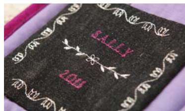
Spiegel, combineer steken en sla ze op en geef uw ontwerp uw eigen accenten. Tot 4 lettertypes. U kunt uit verschillende stijlen kiezen.

Voor naaien uit de vrije hand brengt u de transporteur omlaag en bevestigt u de free-motionvoet (optioneel) . Wanneer u met de tweelingnaald werkt, past het tweelingnaaldprogramma de steekbreedte aan om te voorkomen dat de naald breekt.