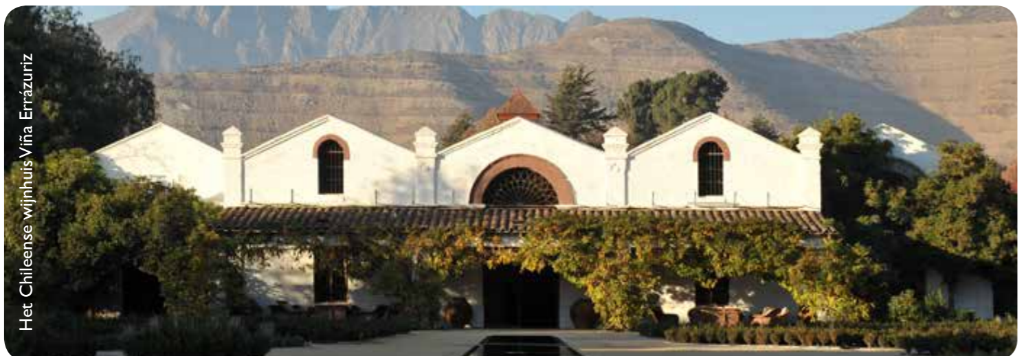
Het Chileense wijnhuis Viña Errázuriz