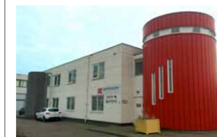
NORWAY COATINGS - UTRECHT - NEDERLAND

088-4505400 (NL) info@norwaycoatings.nl www.norwaycoatings.nl www.jotun.com