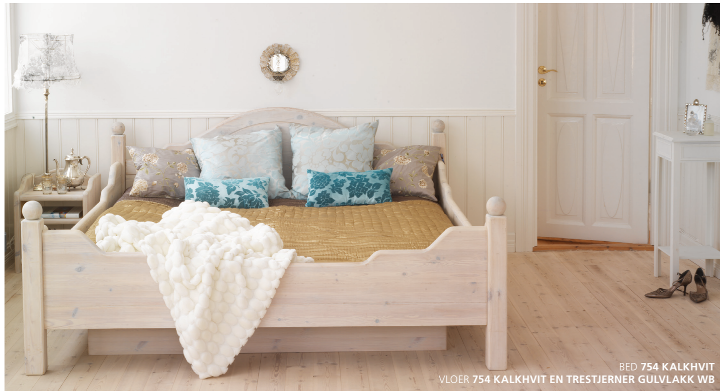
BED 754 KALKHVT VLOER 754 KALKHVT EN TRESTJERNER GULVLAKK WB