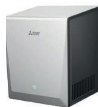
Jet Towel Smart zilver