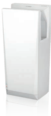
Jet Towel Slim wit