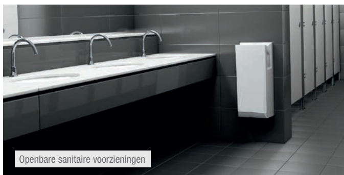
Openbare sanitaire voorzieningen