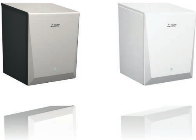
Jet Towel Smart standaard in zilver en wit (Jet Towel Smart Lite standaard in wit leverbaar)

Als bijzonder zuinig alternatief is er de Jet Towel Smart Lite. Hij verwarmt de luchtstroom niet, verbruikt daardoor minder energie en vermindert bovendien de verbruikskosten bij ieder gebruik. Bovendien is de aankoopprijs dankzij de uitvoering in schokbestendige kunststof voordeliger.