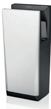
Jet Towel Slim zilver