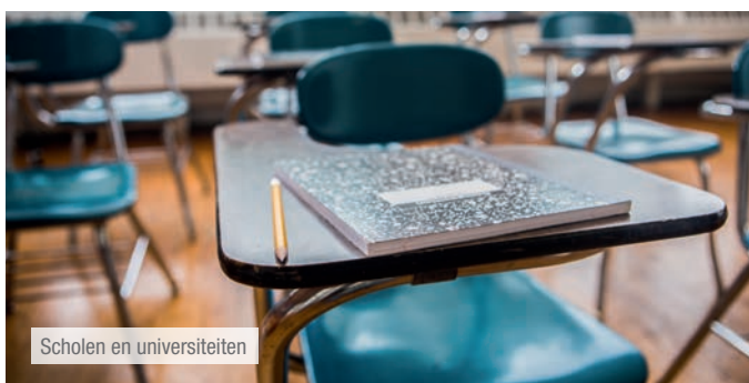
Scholen en universiteiten