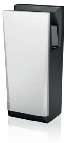
Jet Towel Slim zilver