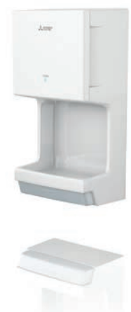
Jet Towel Mini wit

Ook de Jet Towel Mini onderscheidt zich door zijn geringe bedrijfskosten. Zijn gelijkstroommotor werkt energie-efficiënt en stil. Hij produceert een gelijkmatige luchtstroom met uitstekende droging. De Jet Towel Mini heeft een krachtige (High) en een zuinige modus (Standard). Bovendien kan naar wens de verwarming van de luchtstroom worden in- of uitgeschakeld. Zo kan hij optimaal op individuele toepassingen worden afgestemd.