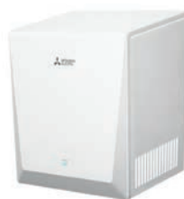
Jet Towel Smart wit