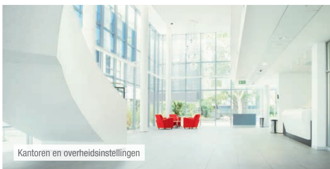
Kantoren en overheidsinstellingen