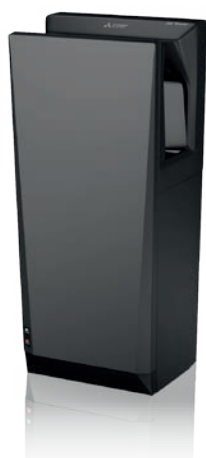
Jet Towel Slim donkergrijs