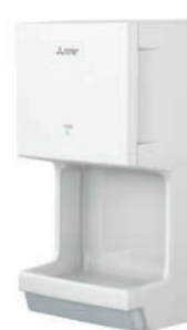
Jet Towel Mini wit