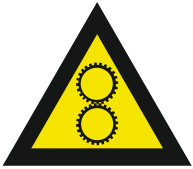
Pic. 299 Gevaar voor draaiende onderdelen