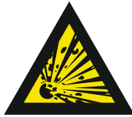
Pic. 301 Explosieve stoffen