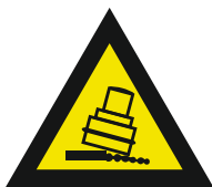
Pic. 319 Kantelgevaar