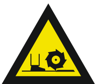
Pic. 318 Frees-as