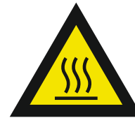
Pic. 315 Warm oppervlak