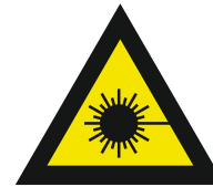
Pic. 309 Laserstraal