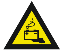
Pic. 310 Gevaren door accu's