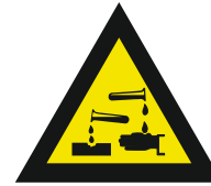
Pic. 303 Bijtende (corrosieve) stoffen