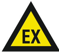
Pic. 313 Atmosfeer met ontploffingsgevaar