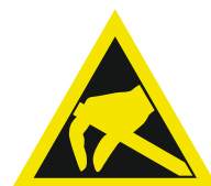
Pic. 327 Voor statische lading gevoelige componenten