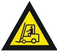
Pic. 306 Industriële voertuigen