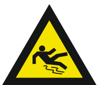
Pic. 324 Slipgevaar