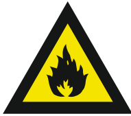
Pic. 300 Brandgevaarlijke stoffen