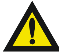
Pic. 308 Opgelet gevaar