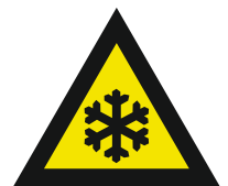
Pic. 323 Lage temperaturen