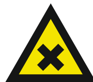
Pic. 321 Schadelijke of irriterende stoffen