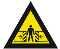
Pic. 316 Waarschuwing voor bekneld raken