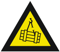
Pic. 305 Hangende lasten