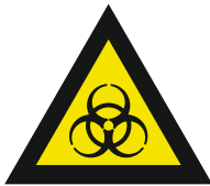
Pic. 312 Biologisch besmettingsgevaar