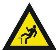
Pic. 326 Trede