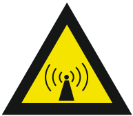
Pic. 311 Niet-ioniserende straling