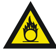
Pic. 314 Oxyderende stoffen