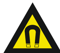
Pic. 322 Sterk magnetisch veld