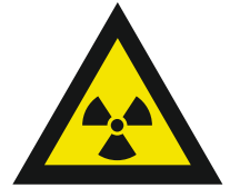
Pic. 304 Radioactieve stoffen of ioniserende straling