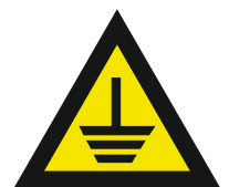
Pic. 329 Aarding