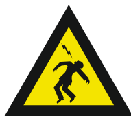
Pic. 320 overslaande spanning