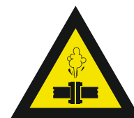
Pic. 328 Stoom onder hoge druk