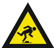
Pic. 325 Struikelgevaar