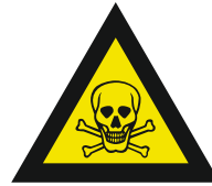
Pic. 302 Giftige stoffen