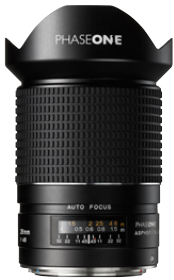
28mm AF f/4.5

Ein ausgezeichnetes Ultraweitwinkelobjektiv für das digitale Vollformat. Ideal für Landschafts- und Architekturfotografie sowie für kreative Bildgestaltung.