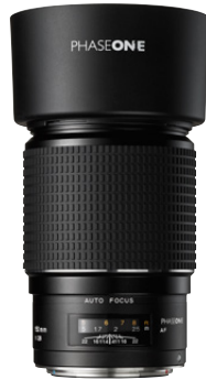
150mm AF f/2.8

Um die Effizienz bei der Hochzeits- oder Portraitfotografie zu erhöhen, bietet dieses Objektiv schnelle Innenfokussierung und ermöglicht eine einfache Verwendung von Effektfilttern.