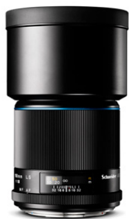
150mm LS f/3.5

Ein Portraitobjektiv, das sich hervorragend zur Mode-, Beauty-, Lifestyle- und Sportfotografie eignet.