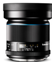
55mm LS f/2.8

Das Weitwinkelobjektiv ist nahezu verzeichnungsfrei und verleiht Ihren Bildern einen natürlichen Look, ideal für Portrait- und Lifestyle-Fotografie.