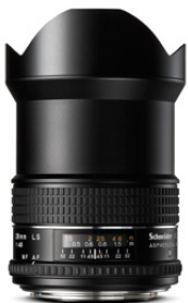
28mm LS f/4.5

Perfekt für Interior, Landschaften, Architektur und Editorials, ermöglicht schnelle Blitzsynchronisation.