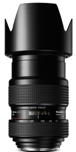
75-150mm LS f/4.0

Ermöglicht Blitzsynchronisationen von bis zu 1/1600s und die größtmögliche kreative Freiheit bei der Bildkomposition.