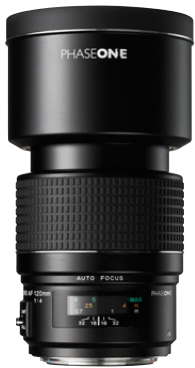
120mm AF f/4 Makro

Das 120mm AF Makro erzeugt bei der Beauty-, Portrait- und Makrofotografie eine atemberaubende Bildschärfe. Im Bereich der extrem detaillierten Abbildung liefert das Objektiv großartige Ergebnisse.