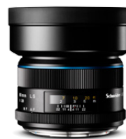
80mm LS f/2.8

Das ideale Objektiv für Modefotografen „on location“, die mit Aufhellblitz arbeiten. Diese Optik sollte in keiner Kameratasche fehlen.