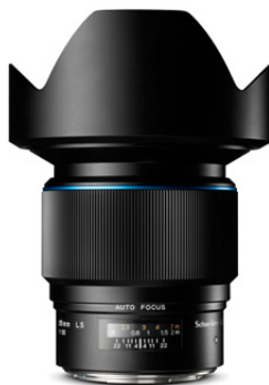
35mm LS f/3.5

Dieser Weitwinkel liefert sowohl bei Tages- als auch bei Blitzlicht absolut erstklassige Ergebnisse.