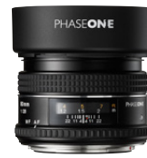
80mm AF f/2.8

Großartiges Universalobjektiv mit herausragender optischer Leistung. Motive werden mit unglaublichen Details und Präzision aufgenommen.