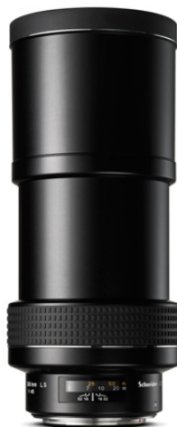
240mm LS f/4.5

Ob bei der Sport-, Beauty-, Tier- oder Landschaftsfotografie, dieses Objektiv ist optimal für Großaufnahmen aus der Ferne.