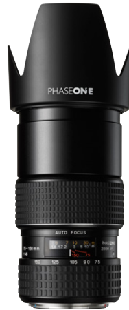
75-150mm AF f/4

Das Objektiv ist absolut vielseitig und ist somit der perfekte Begleiter für Fotografen „on location“, da es großartige Bildqualität bei allen Brennweiten garantiert.