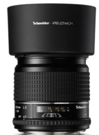
110mm LS f/2.8

Dieses Objektiv mit einer langen Brennweite ist optimal für ganzfigurige Mode-, Beauty- und Portraitaufnahmen.