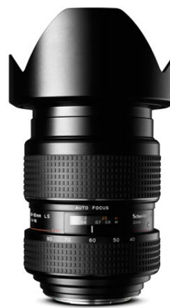
40-80mm LS f/4.0

Ultrascharfe Bildwiedergabe bei allen Brennweiten. Die Qualität dieses Zoomobjektivs lässt sich mit der von Festbrennweiten vergleichen.