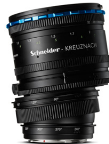
120mm TS f/5.6

Perfekt für die Arbeit im Studio, Produktfotografie und für atemberaubende Bilder mit verschobener Schärfenebene. 8° Tilt, 12mm Shift, 360° auf zwei Achsen.