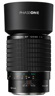
120mm MF f/4 Makro

Bei Beauty-, Portrait- oder Makroaufnahmen wird dieses Objektiv hervorragende Ergebnisse liefern.