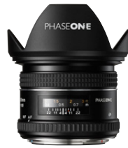
35mm AF f/3.5

Kompaktes und leichtes Weitwinkelobjektiv. Ideal für Straßen-, Landschafts-, Interior- oder Architekturfotografie.