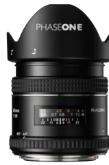
45mm AF f/2.8

Aufgrund geringer Streuung bietet dieses Weitwinkelobjektiv minimale chromatische Aberration und ist optimal für kontrastreiche Shootingbedingungen.