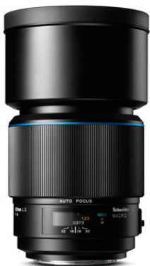
120mm LS f/4.0 Makro

Ideal für Produktaufnahmen aus geringer Distanz sowie für Beauty-, Action-, Natur- und Tierfotografie.